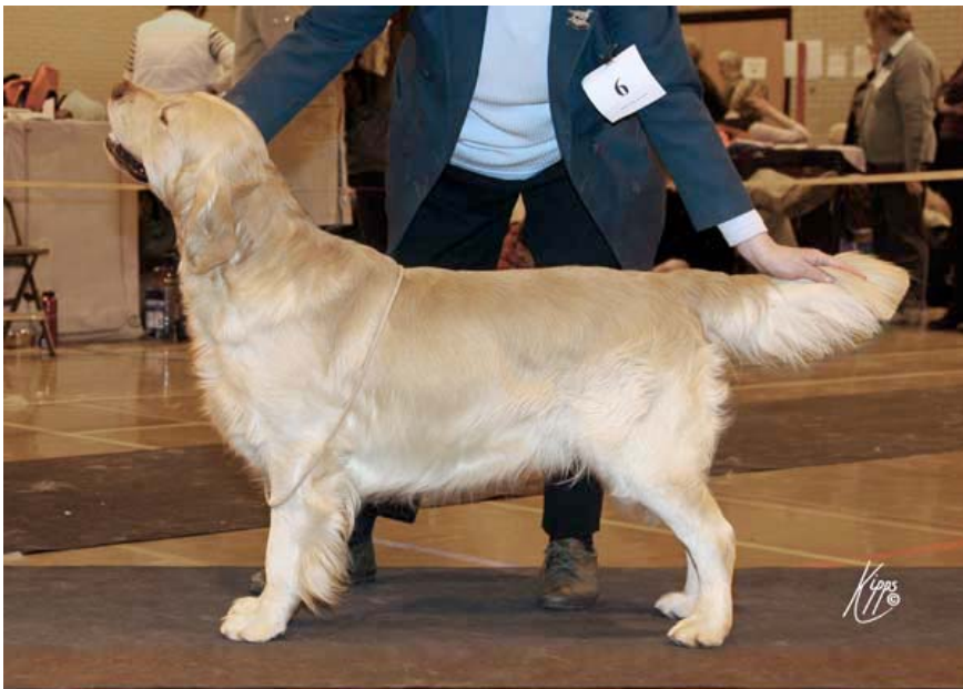
Doodle winning Best in Show at the GRC of Wales Ch Sh on 16th February 2008

Below are some pictures of Doodle at work